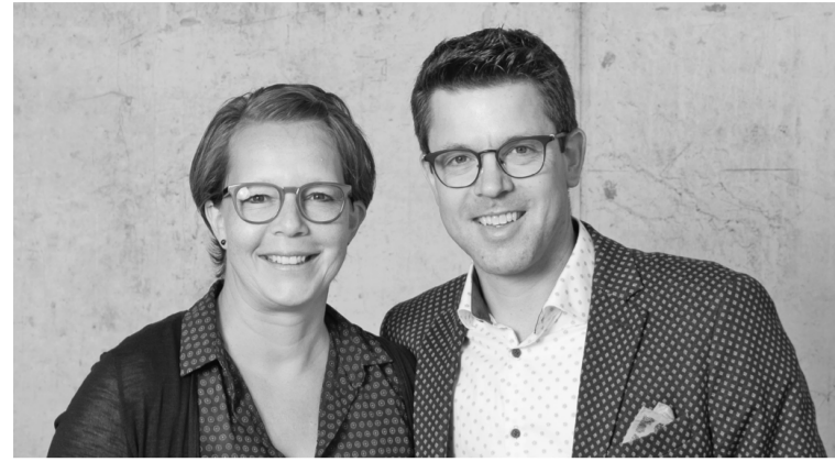
Geschätzte Frauen und Mannen

Wir freuen uns, Ihnen unsere erste Gazette mit Gesundheits-Informationen und Produkt-Tipps präsentieren zu können.